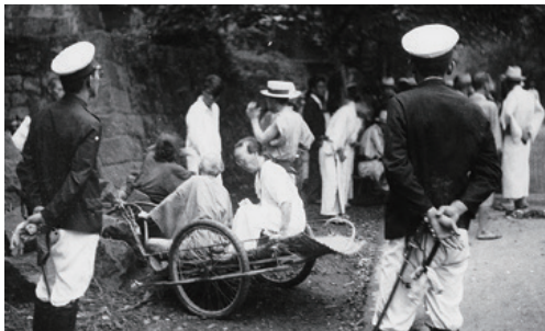
ハンセン病と診断された患者は強制的に療養所に入所させられました。

1953年(昭和28年)、患者の反対を押し切ってこの法律を引き継ぐ「らい予防法」が成立しました。この法律の問題点は、患者隔離が継続され、退所規定が設けられていないことでした。つまり、ハンセン病患者は療養所に収容されると