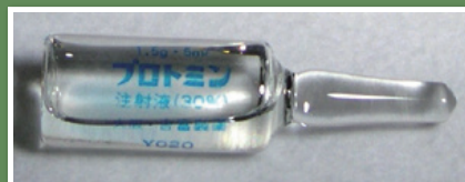
プロミン(注射薬)