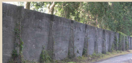
菊池恵楓園(熊本県)の隔離の壁

また、2019年(令和元年)、ハンセン病政策により家族も差別や偏見の被害を受けたとして、元患者の家族が国を相手に起こしたハンセン病家族訴訟についても、熊本地裁で原告勝訴の判決が下されました。