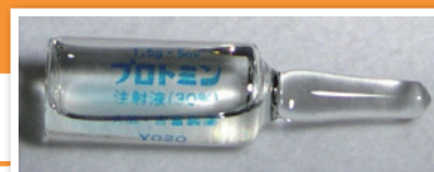
プロミン（注射薬）