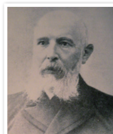
アルマウエル・ハンセン医師