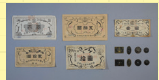
園内通用券(多摩全生園)