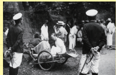
ハンセン病と診断された患者は強制的に療養所に入所させられました。

(注2) 園内通用券：療養所では、入所者の逃亡を防止するため、お金の代わりにその療養所でしか通用しない券を発行しました。