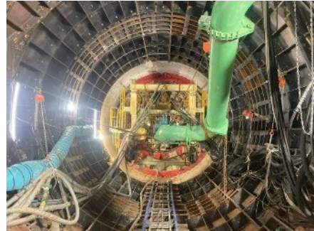
坑内状況 (8m掘進時点 全702m)