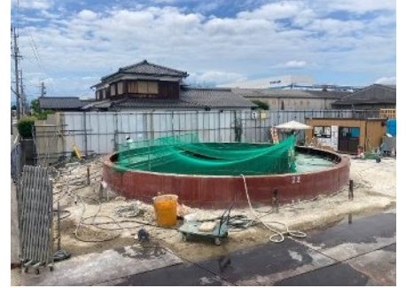
到達基地状況 (シールド到達部地盤改良状況)