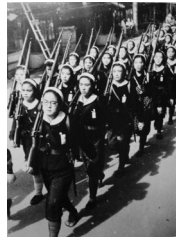
▶軍事訓練をする女学生