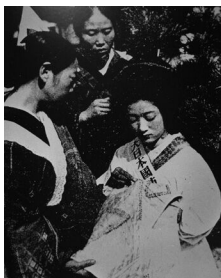
▲一針一針に必勝と生還を縫い込めた千人針の風景