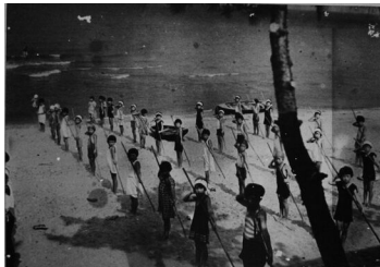
◀小学生のナギナタ訓練