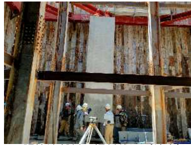
調節池部材の据付状況（地中）