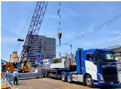
調節池部材の荷卸し状況

○ 掘削工(土を掘り場外へ搬出する工事)、立坑築造工、推進工及び、掘削工が完了したところから調節池部材の据付を進めています。