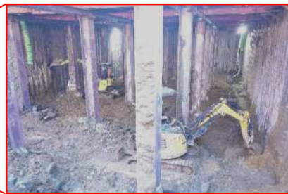
地中での作業状況