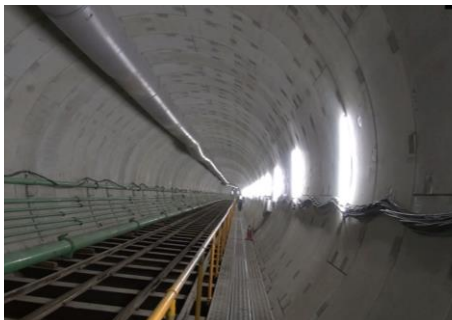
坑内状況 (掘進完了箇所)