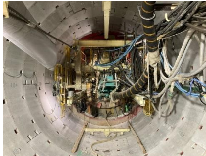
坑内状況 (682m掘進地点 全702m)