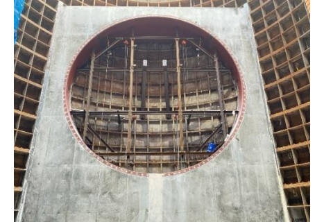
到達立坑内状況 (坑口コンクリート打設完了)