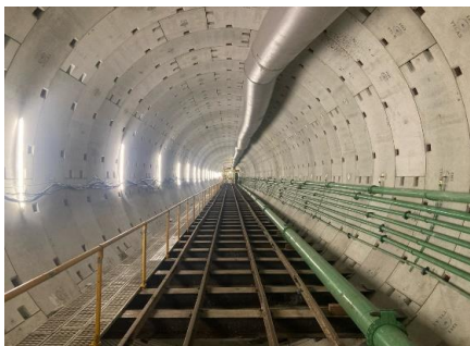
坑内状況 (120m地点から切羽側を望む)