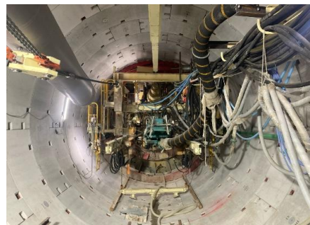
坑内状況 (274m掘進時点 全702m)