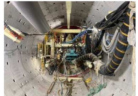
坑内状況 (96m掘進時点 全702m)