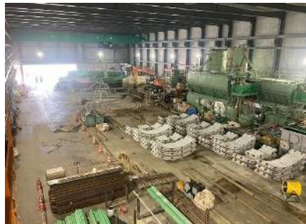
防音ハウス内状況