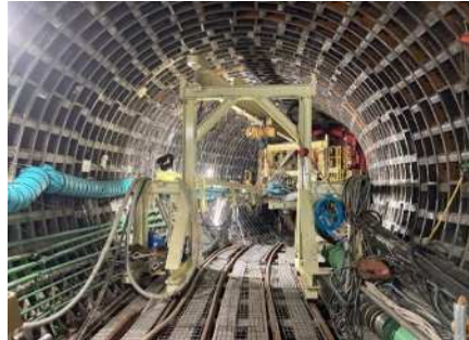
坑内状況 (急曲線区間 R=16m)