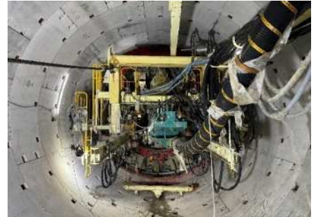
坑内状況 (52m掘進時点 全702m)