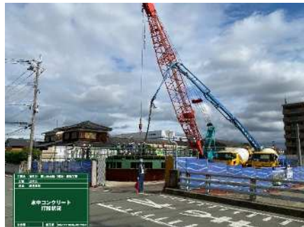
到達立坑 水中コンクリート打設状況