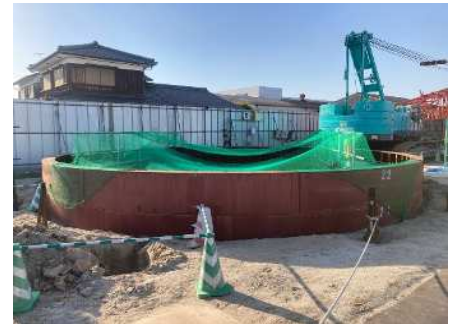
到達基地状況 (立坑築造状況)