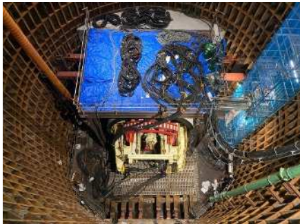
発進立坑内状況 (シールド機インストール後)