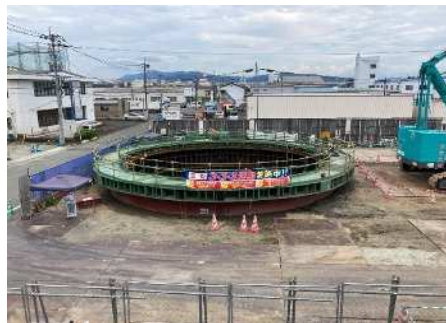
圧入設備撤去完了