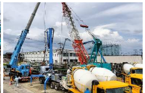
水中コンクリート打設状況(7/22)