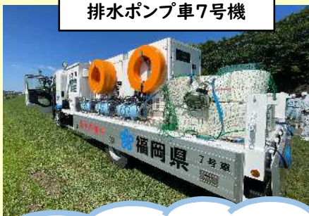
排水ポンプ車7号機

30m 3 /分の排水能力を持ち、25mプールの水を10分程度で排水することができます。