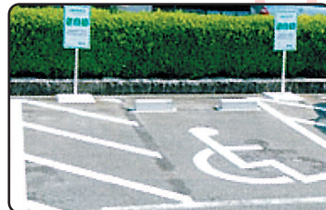
目印ステッカーが掲示してあるスペースで利用できます