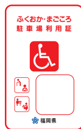
赤色 (車椅子常時利用の身障者で自ら運転)