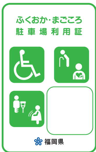
緑色 (身体・知的・精神障がいのある方、高齢者、難病者)

赤色の利用証は、車椅子常時利用の身体障がいのある方で、自ら運転する方に交付しています。幅の広い駐車場が必要な方となりますので、ご配慮をお願いします。