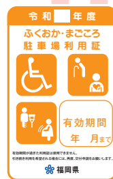
オレンジ色 (妊産婦、けが人)