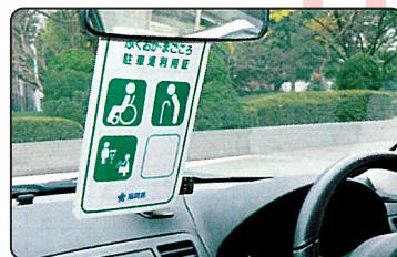
利用証をルームミラーに掛けて使用します