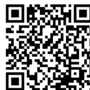
👉公式サイトは こちら！