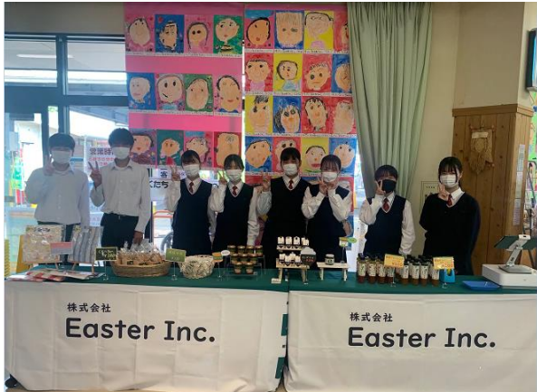
道の駅原鶴での販売会の様子