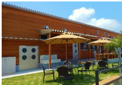
観光ステーション北斗七星