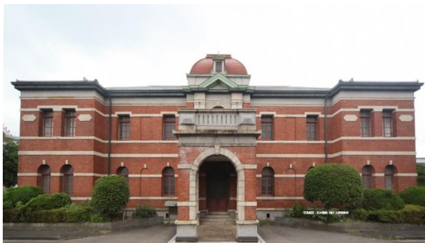
官営八幡製鐵所旧本事務所