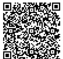
📄 自転車道案内図 はこちら