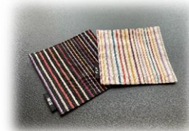
小倉織コースター