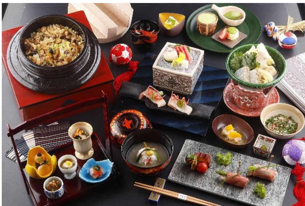
《福岡県フェア特別コース》