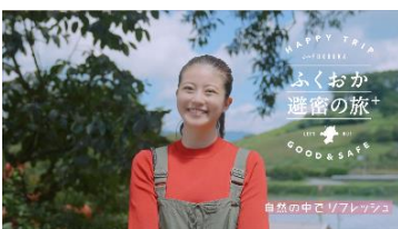
『自然の中でリフレッシュ編』