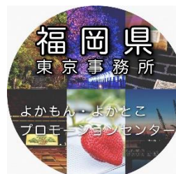
プロフィール画像