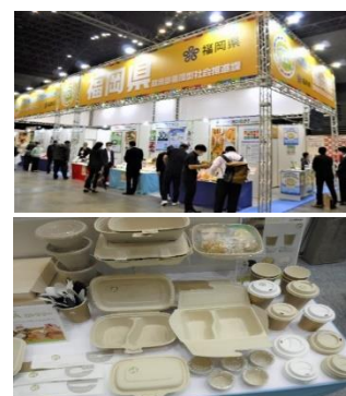
↑紙やバガスで作った弁当容器等