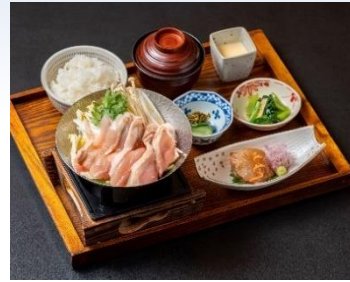
はかた地どりの鶏すき御膳

また、今秋のディナーコースは「四季の宴」に加え、「鐘崎漁港直送 天然クエづくし」が新登場！福岡ではアラと呼ばれる高級魚の身の引き締まった白身を刺身から最後は出汁の一滴に至るまで余すことなくお楽しみいただけます。福岡の秋の味をぜひご堪能ください。