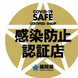
感染防止認証マーク

https://www.pref.fukuoka.lg.jp/contents/certified-shop.html