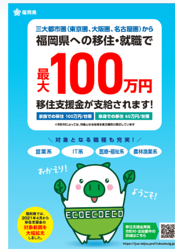
移住支援金事業実施市町村一覧