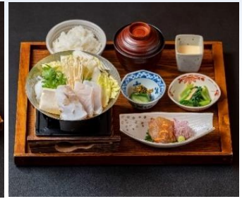
鐘崎漁港直送 天然クエ小鍋御膳