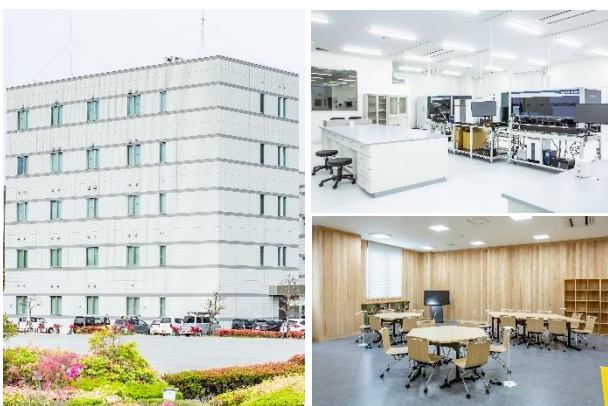
■ 福岡バイオイノベーションセンター

本年4月に久留米市で新インキュベーション施設「福岡バイオイノベーションセンター」が開所されました。最先端バイオ技術に対応する設備や交流スペースが設けられています。研究開発から製品化まで専念でき、入居する事業者同士の新たな可能性を広げる環境が整備されています。