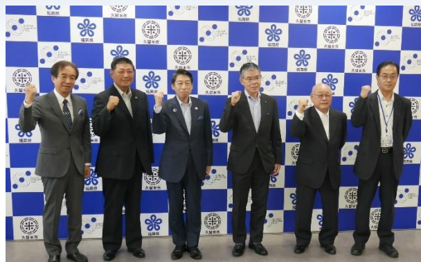
■ 認定後の県知事と久留米市長による共同記者会見の様子

この認定により、国が実施する各種施策を最大限活用することが可能となり、「福岡バイオバレープロジェクト」の更なる加速が期待されます。