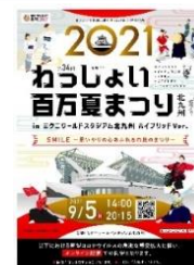
ポスターデザイン