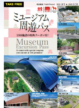
ミュージアム周遊パス表紙

掲載内容：九州・沖縄・山口各県の美術館・博物館等188施設の基本情報（所在地、開館時間、休館日等）、特典内容、見所等