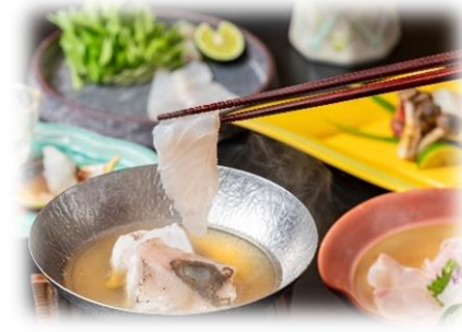
鐘崎漁港直送 天然クエづくし