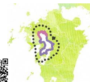
■ 有明海一周ルート