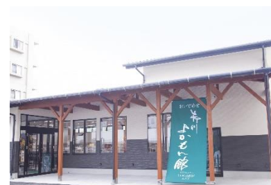
■ 柳川よかもん館(柳川市)