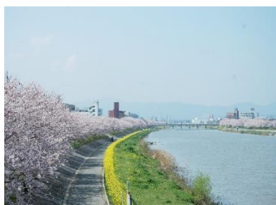
■ 今川サイクリングロード(行橋市)