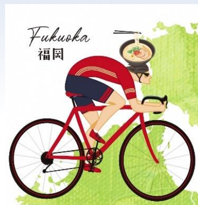
■ マップデザイン(福岡県)

ルート上に存在する雄大で美しい山々、温泉や歴史・文化、おいしい食事などの魅力を堪能することができる場所の紹介だけでなく、コロナ禍におけるサイクリングマナー等、サイクリストに役立つ様々な情報を掲載しています。自転車に乗って九州・山口地域の魅力を満喫してみませんか。