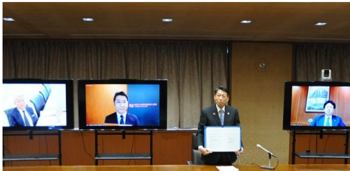
■ 連携協定の締結の様子

外資系企業やグローバル人材が集積することで、継続的にイノベーションを創出する国際都市を目指します。