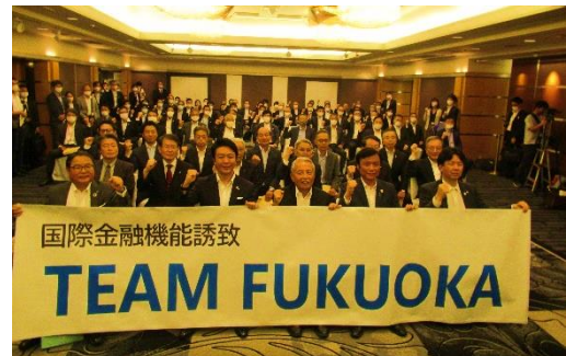
■ TEAM FUKUOKA発足時の様子