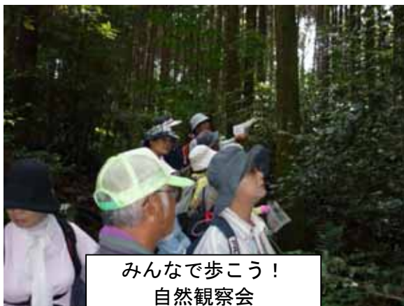
みんなで歩こう！ 自然観察会