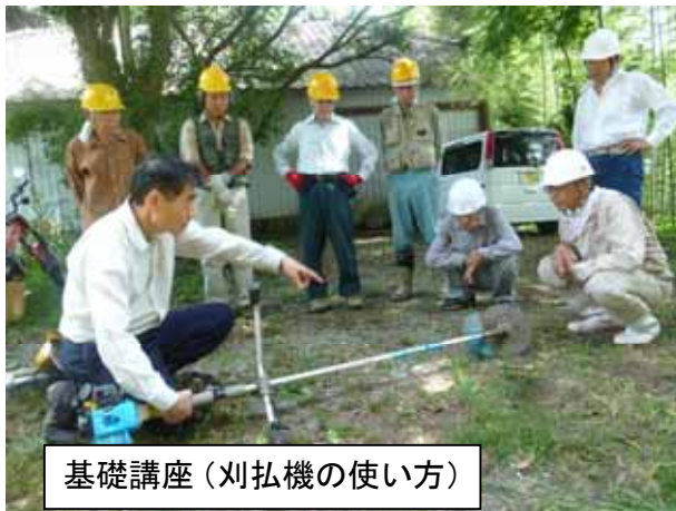
基礎講座（刈払機の使い方）