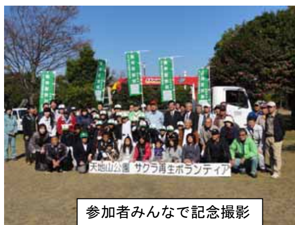
参加者みんなで記念撮影