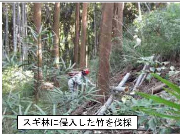
スギ林に侵入した竹を伐採