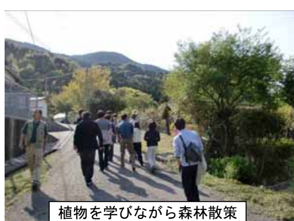
植物を学びながら森林散策