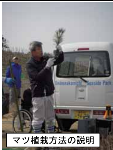
マツ植栽方法の説明