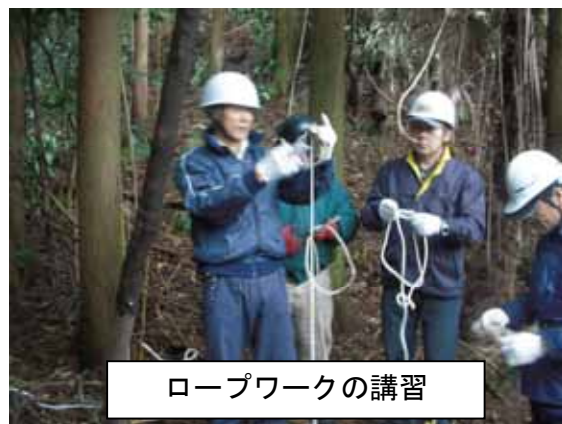
ロープワークの講習