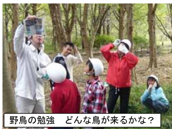
野鳥の勉強 どんな鳥が来るかな？