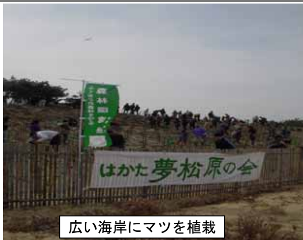
広い海岸にマツを植栽