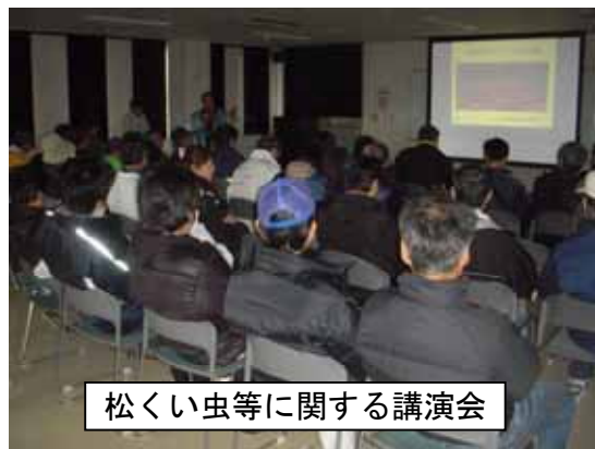
松くい虫等に関する講演会