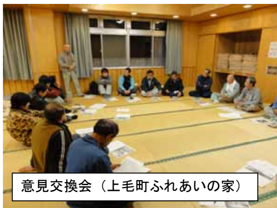
意見交換会(上毛町ふれあいの家)