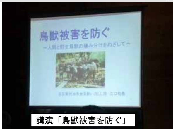
講演「鳥獣被害を防ぐ」