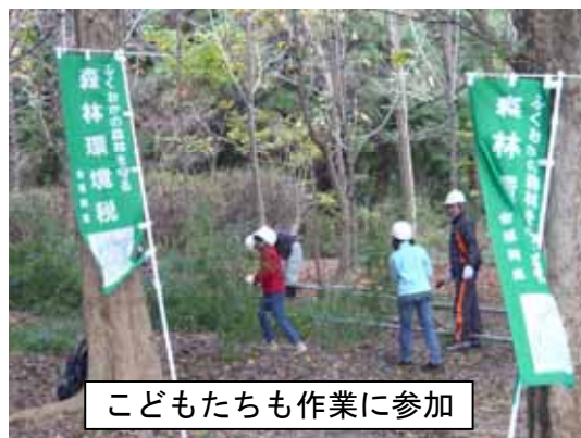
こどもたちも作業に参加