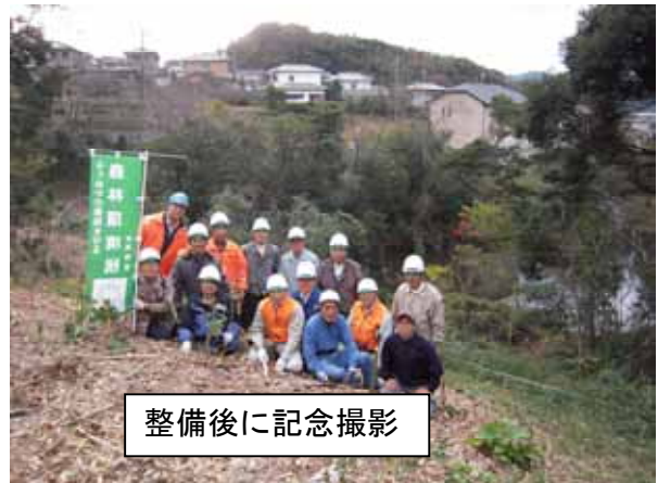
整備後に記念撮影