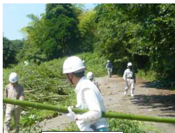
伐採した竹を搬出