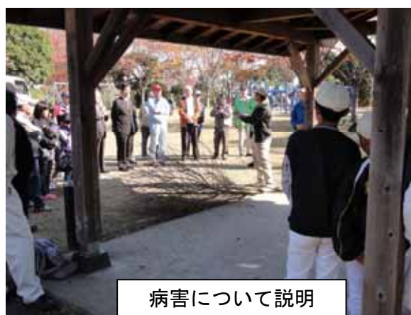
病害について説明