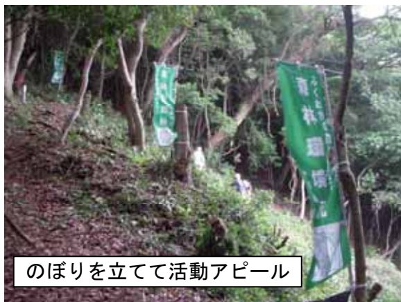
のぼりを立てて活動アピール