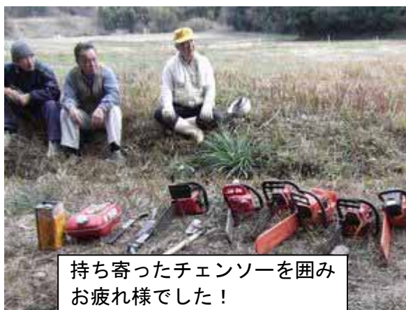
持ち寄ったチェーンソーを囲み お疲れ様でした！