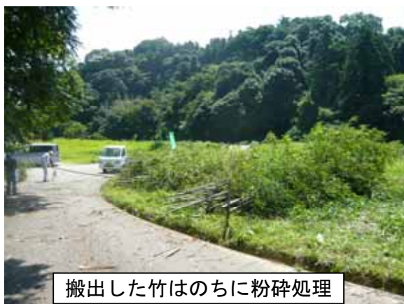
搬出した竹はのちに粉碎処理