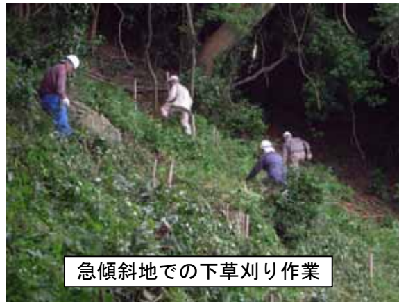
急傾斜地での下草刈り作業