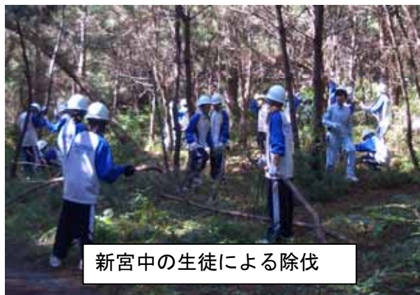
新宮中の生徒による除伐