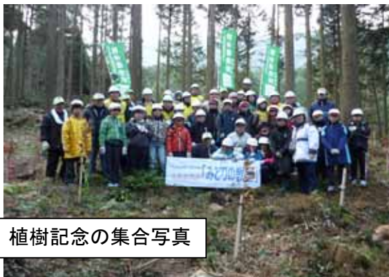
植樹記念の集合写真