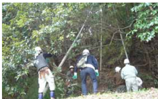
雑木林に侵入した竹を伐採