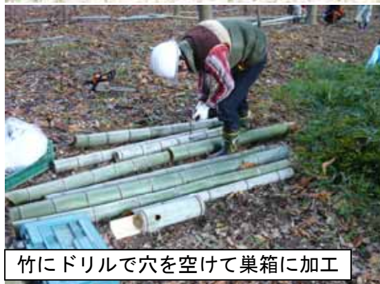
竹にドリルで穴を空けて巣箱に加工