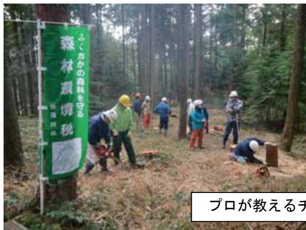
プロが教えるチェーンソーワーク