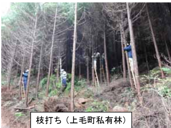
枝打ち(上毛町私有林)