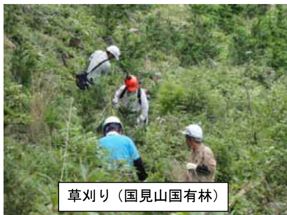
草刈り(国見山国有林)