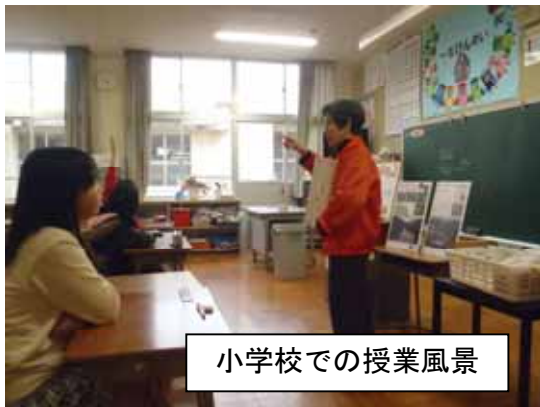
小学校での授業風景