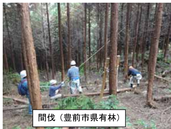
間伐(豊前市県有林)