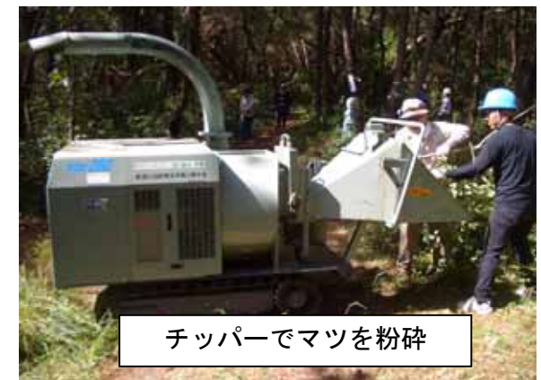
チップパーでマツを粉碎