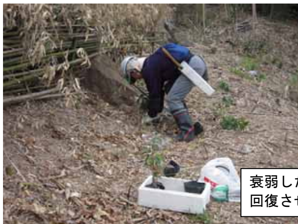
衰弱した幼齢木は自宅へ持ち帰り、回復させてから現地に植樹