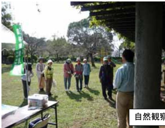
自然観察会の事前説明