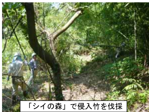
「シイの森」で侵入竹を伐採