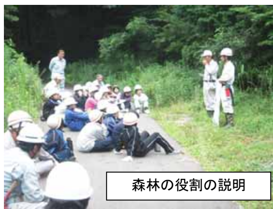
森林の役割の説明