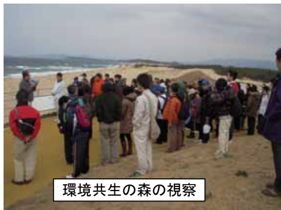
環境共生の森の視察