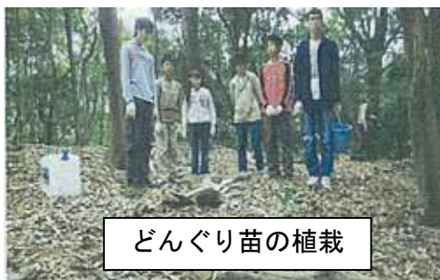
どんぐり苗の植栽