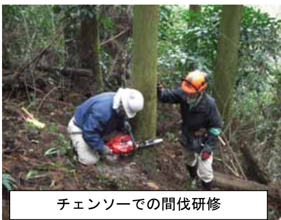
チェーンソーでの間伐研修