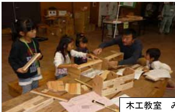
木工教室 みんな一生懸命！