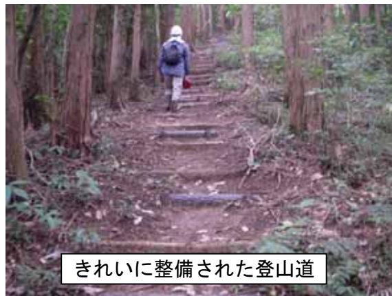
きれいに整備された登山道