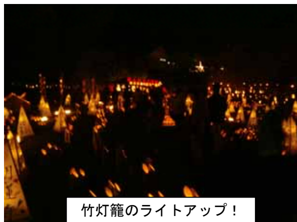
竹灯笼のライトアップ!