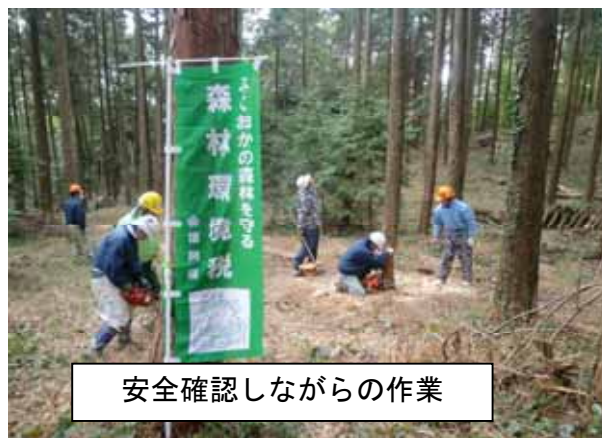
安全確認しながらの作業