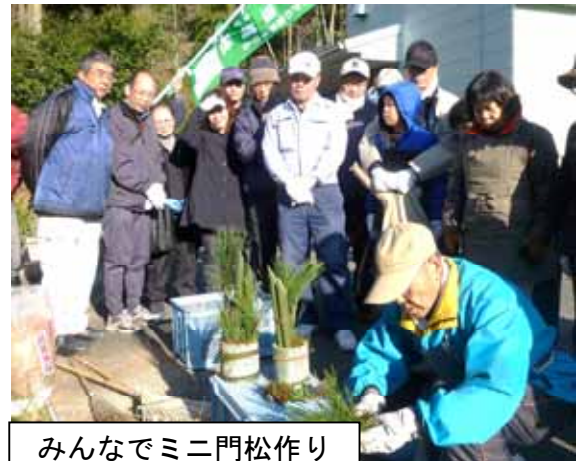
みんなでミニ門松作り