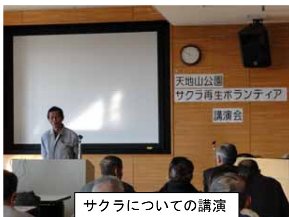
サクラについての講演