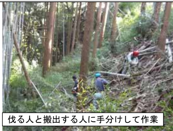
伐る人と搬出する人に手分けして作業