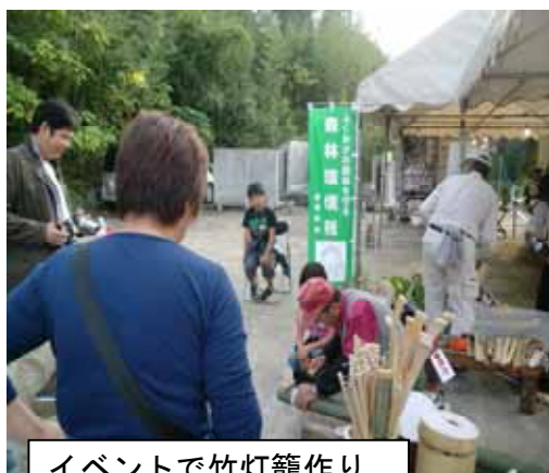
イベントで竹灯笼作り