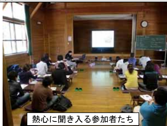
熱心に聞き入る参加者たち