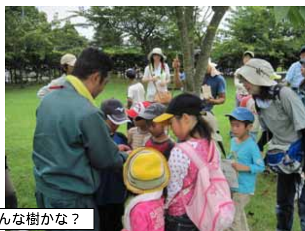
森の中で材料集め