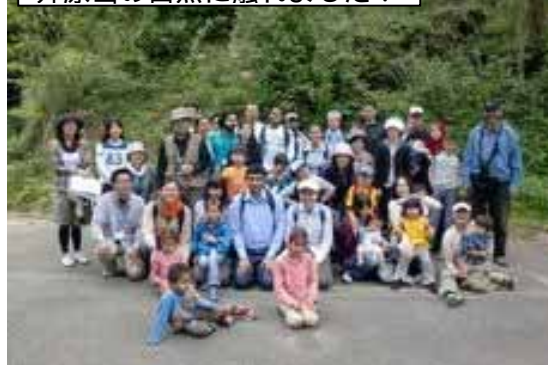
井原山の自然に触れました！