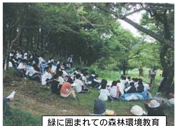
緑に囲まれての森林環境教育