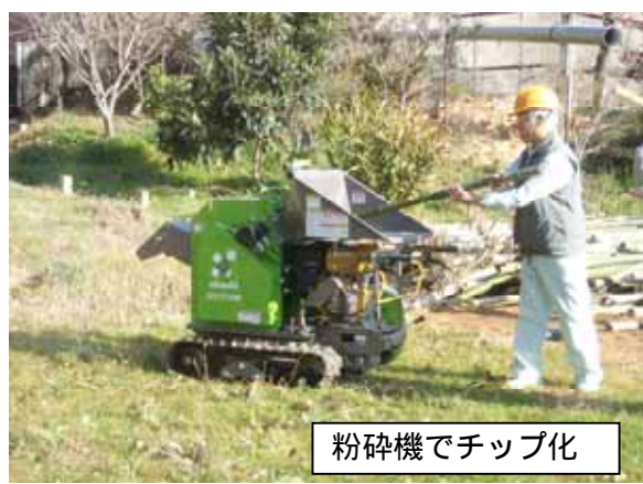
粉碎機でチップ化