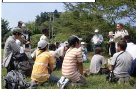
森林散策に向かいます！