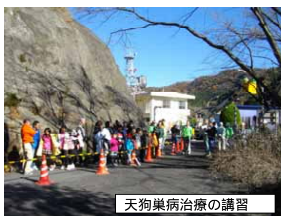
天狗巣病治療の講習