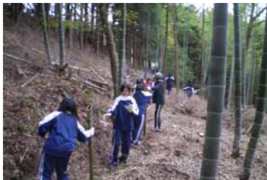
竹林整備：伐採した竹を運び出します