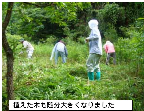
植えた木も随分大きくなりました