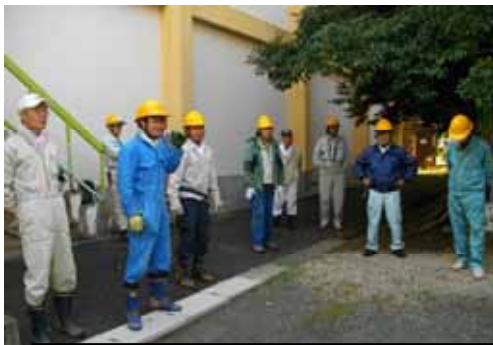
作業前ミーティングは念入りに！