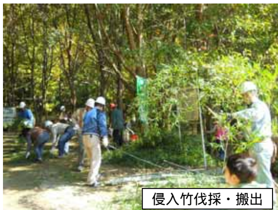
侵入竹伐採・搬出