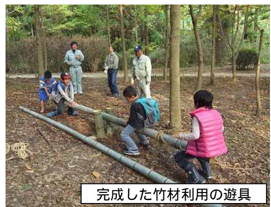
完成した竹材利用の遊具