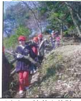
シイタケの植菌を体験！ 自然のリサイクルを学びます