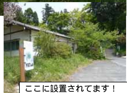
ここに設置されてます！