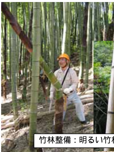
竹林整備：明るい竹林になあれ！