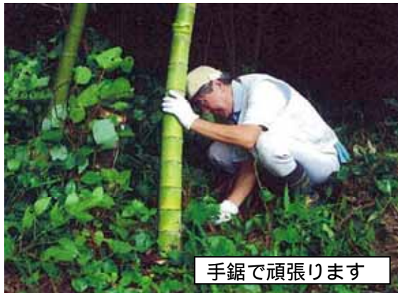
手鋸で頑張ります