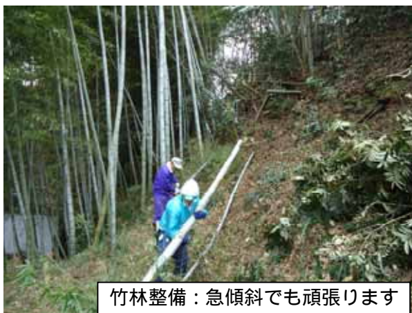
竹林整備：急傾斜でも頑張ります