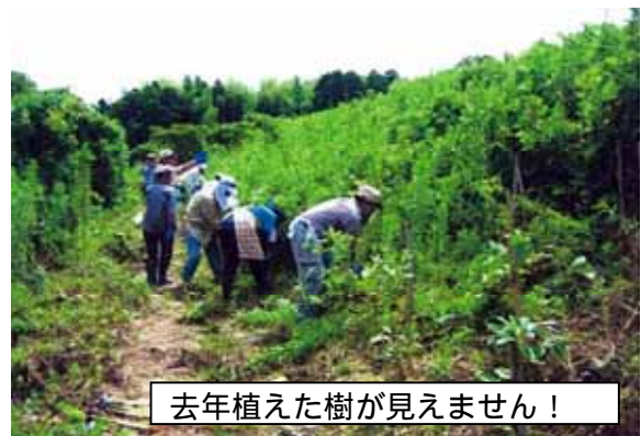
去年植えた樹が見えません！