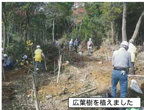
広葉樹を植えました