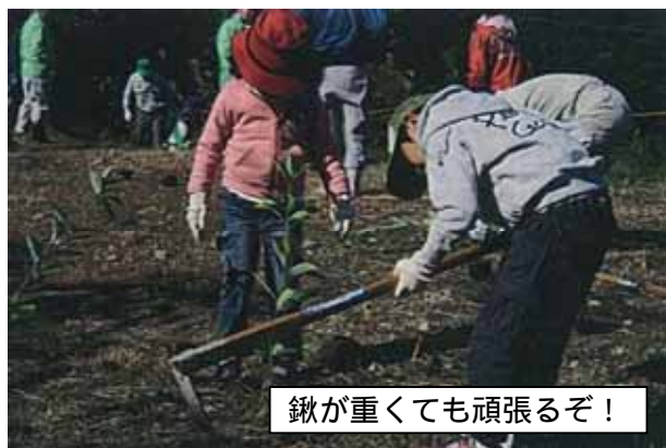
鍬が重くても頑張るぞ！