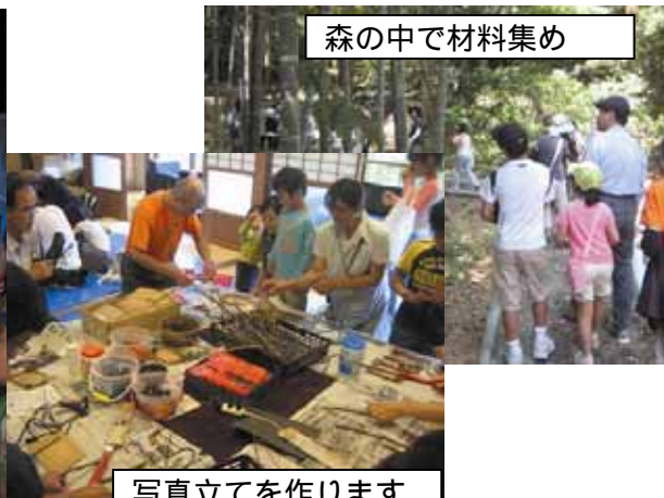
写真立てを作ります