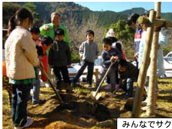
みんなでサクラを植えました