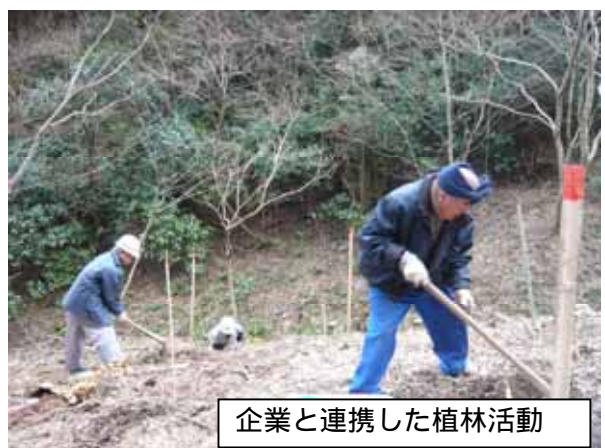
企業と連携した植林活動