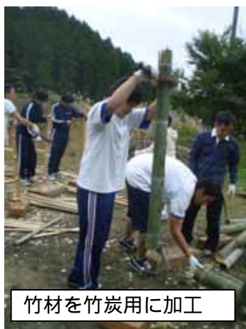
竹材を竹炭用に加工