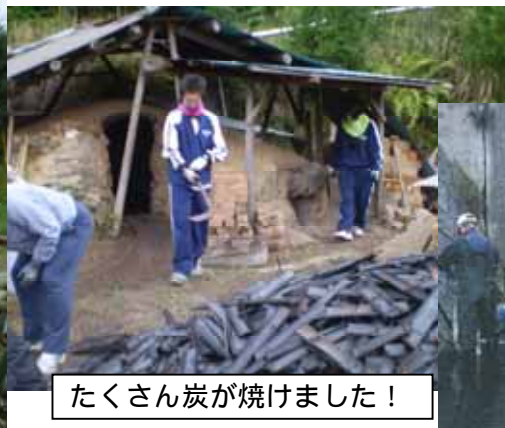
たくさん炭が焼けました！