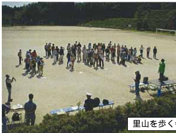
里山を歩く会 大盛況！