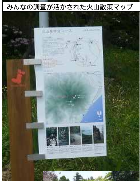
みんなの調査が活かされた火山散策マップ