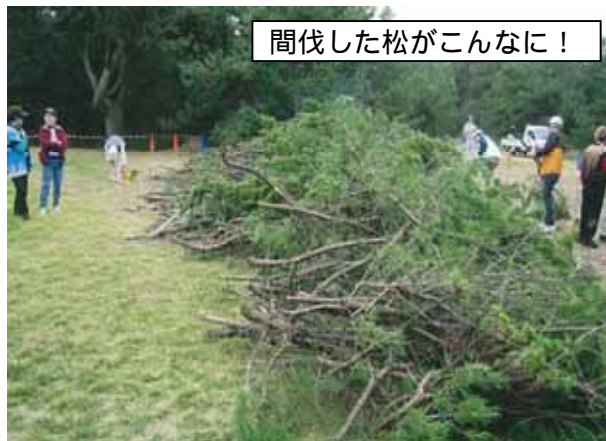
間伐した松がこんなに！