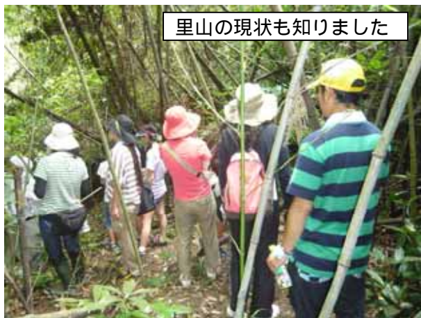
里山の現状も知りました