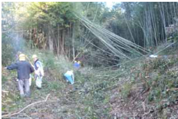
竹林の伐採、どんどんきれいになるぞー！