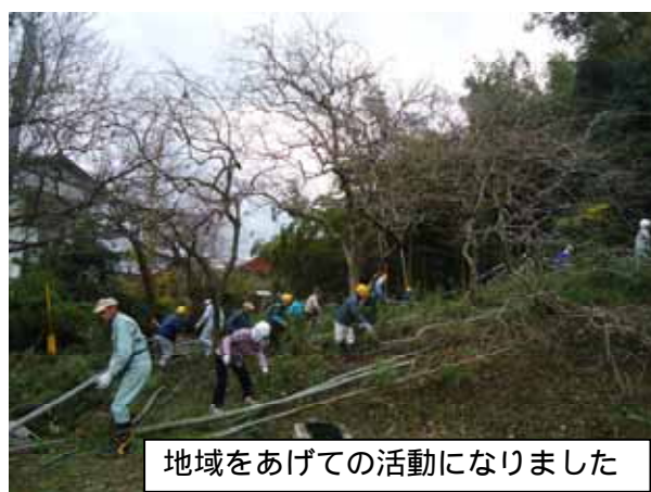
地域をあげての活動になりました