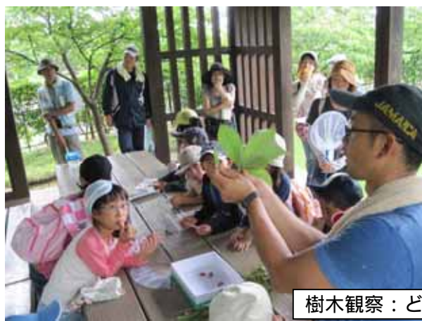
樹木観察：どんな樹かな？