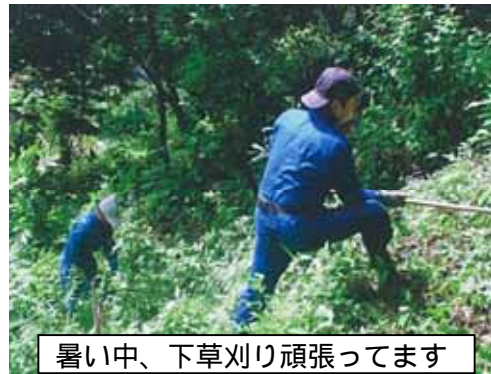
暑い中、下草刈り頑張ってます