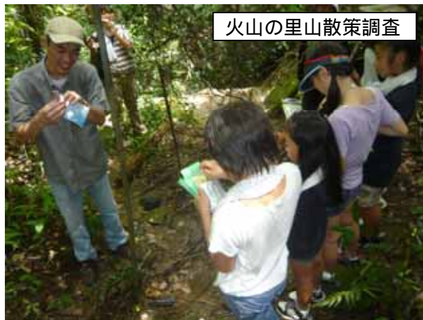
火山の里山散策調査