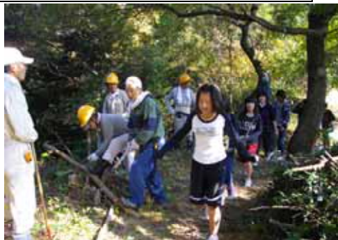
永犬丸西小学校児童と連携