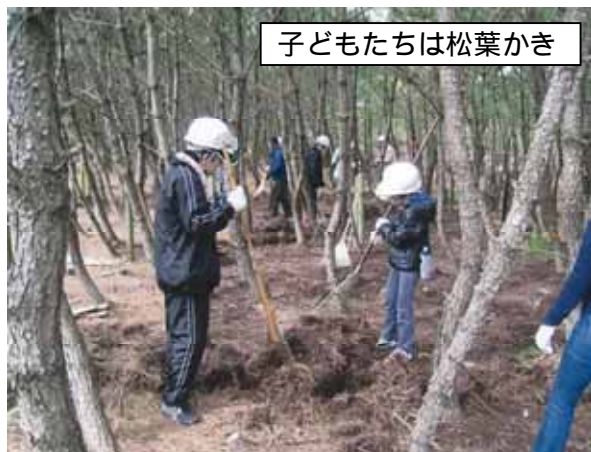
子どもたちは松葉かき