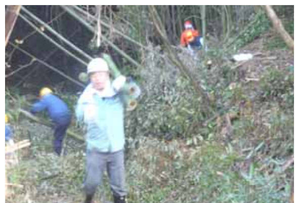
伐採した竹は人力で運び出します