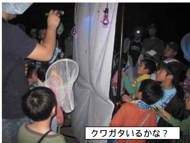
クワガタいるかな？