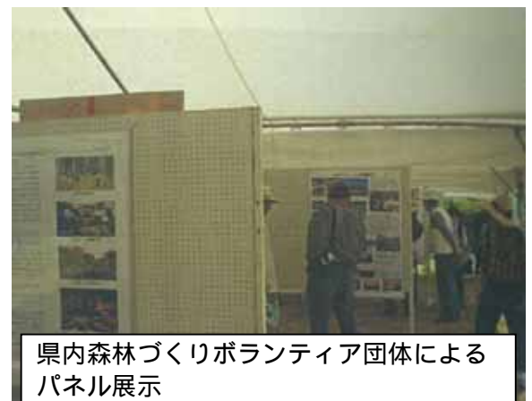
県内森林づくりボランティア団体による パネル展示