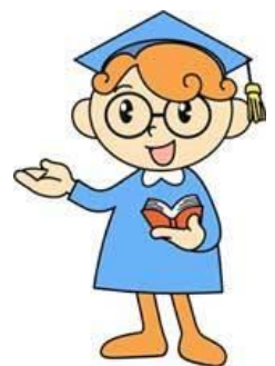
ヒューマン博士 (福岡県の人権啓発 キャラクター)