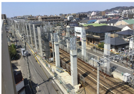
(春日原市境～春日原駅)