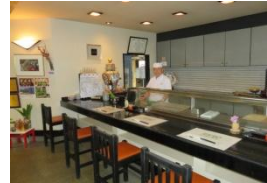
糟屋郡志免町志免4丁目 20-11ハロテ一裏 定休日(月)/092-936-2231