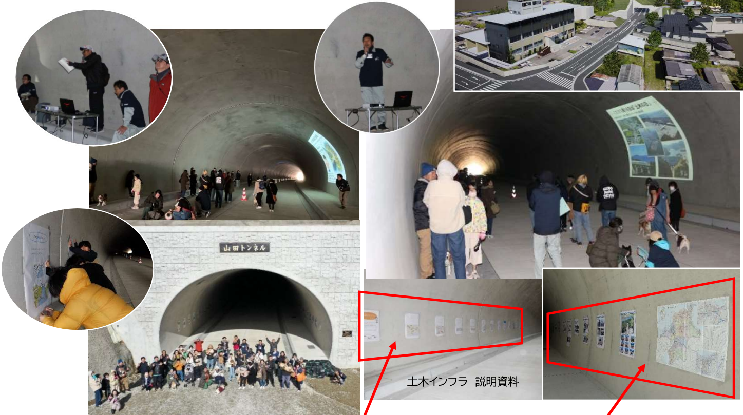
土木インフラ 説明資料