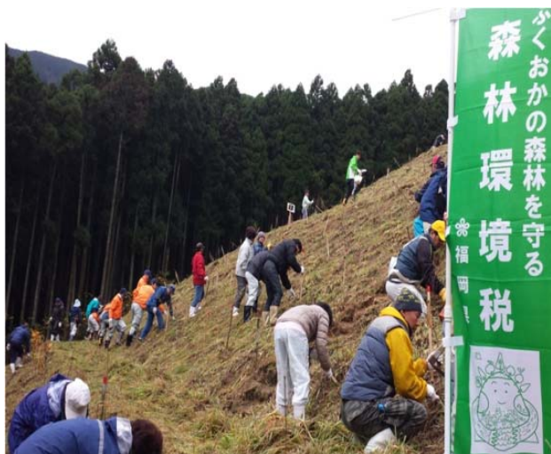
漁業者による森林づくり