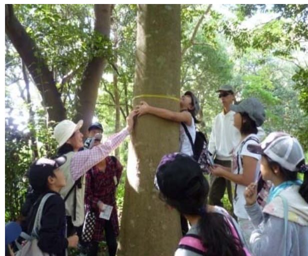
小学生を対象とした森林環境教育