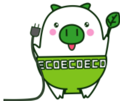
福岡県マスコットキャラクター「エコトン」