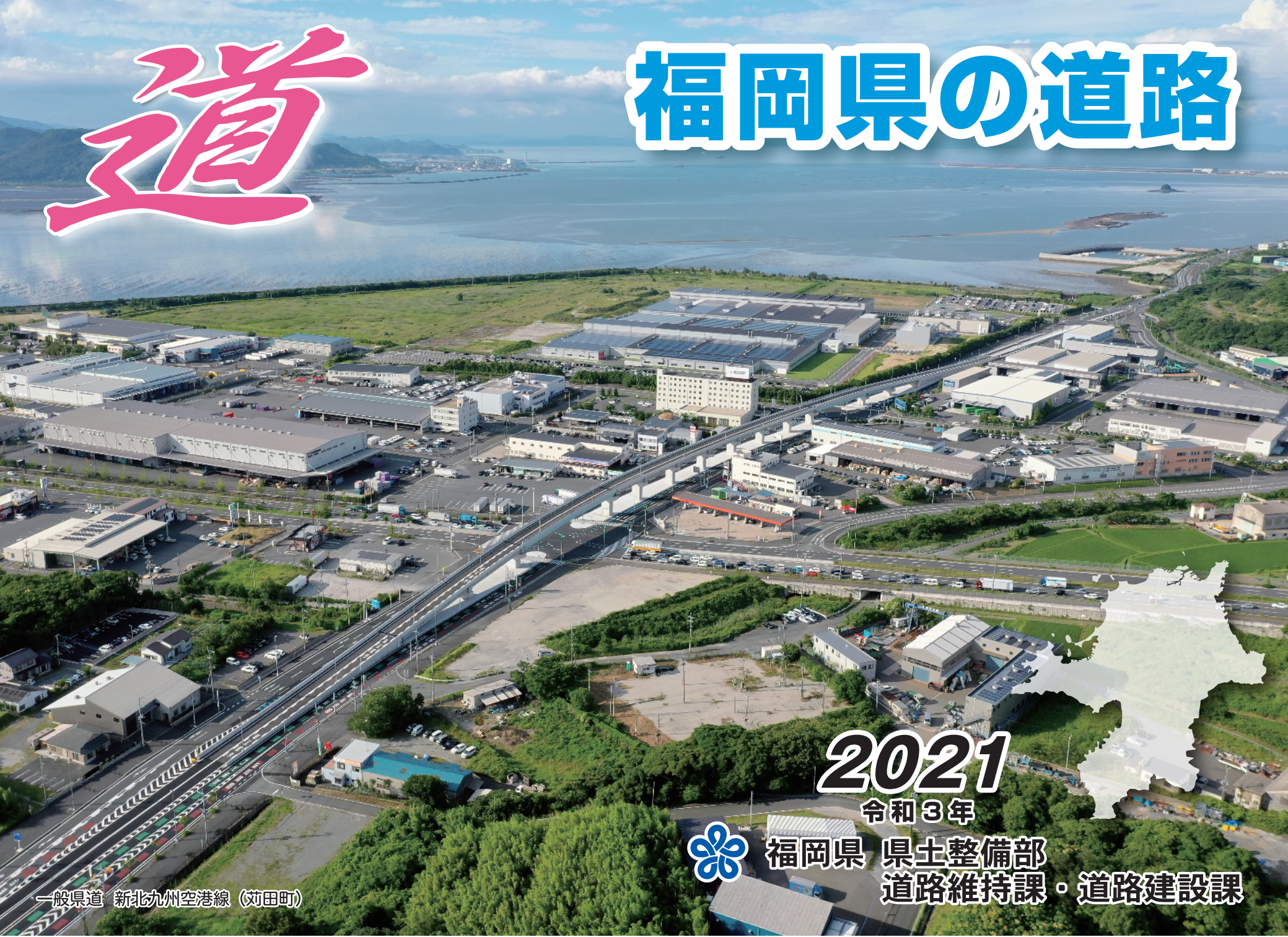
一般県道 新北九州空港線 (荻田町)