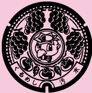
久留米市(田主丸町) 河童, 柿, 葡萄