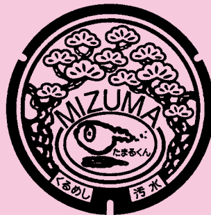
久留米市(三漕町) 三漕町イメージキャラクター 「たまる君」と黒松