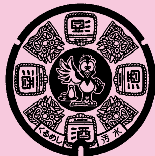
久留米市(城島町) 城島町イメージキャラクター 「インガット君」と酒・鬼瓦