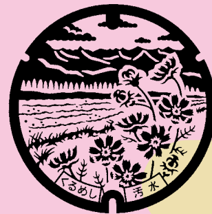
久留米市(北野町) 筑後川, 耳納連山, コスモス