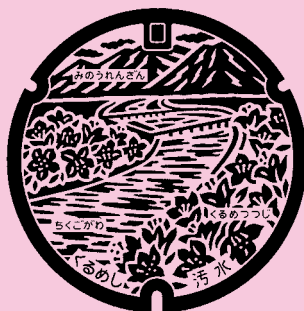
久留米市 筑後川, 耳納連山, クルメツツジ