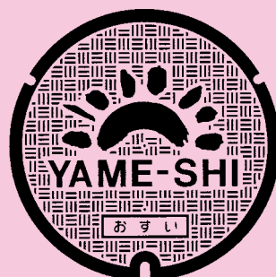
八女市 八女市のシンボルマーク 「山の尾根に八人の女神」