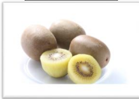
キウイフルーツ「甘うい」