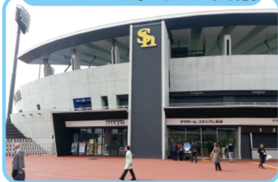
ホークス ちくご HAWKSベースボールパーク筑後

ソフトバンクホークスの2・3軍の本拠地。観戦のあとは船小屋温泉でゆっくりひと息できるよ。