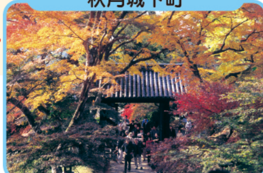
あきづきじょうかまち 秋月城下町