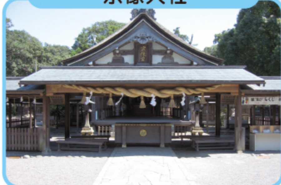
むなかたたいしゃ 宗像大社