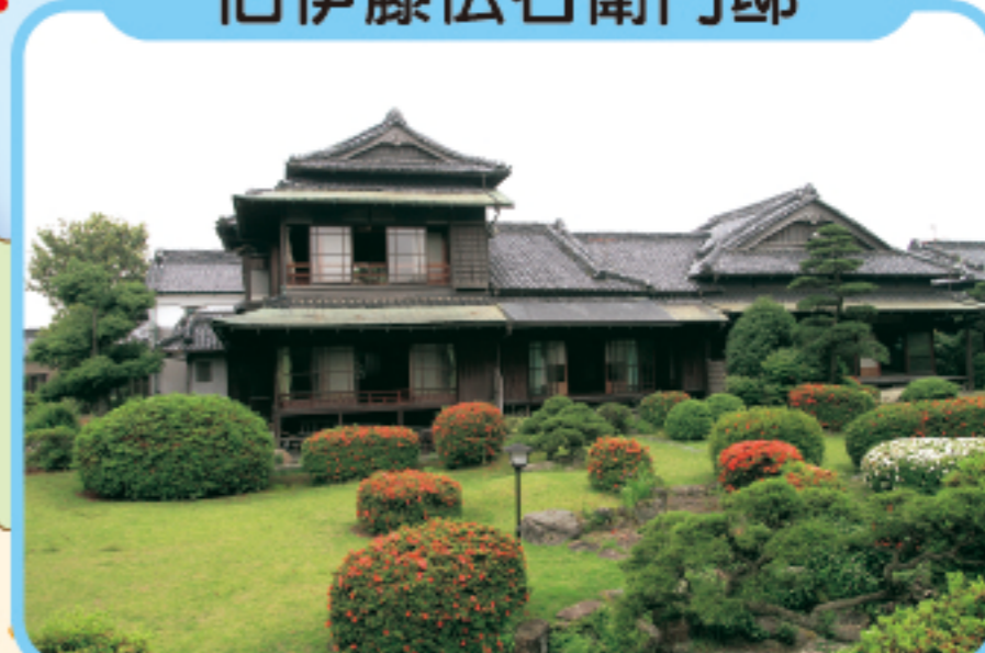
きゅういとう だんえもんてい 旧伊藤伝右衛門邸