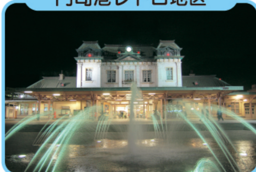
もじこう ちく 門司港レトロ地区