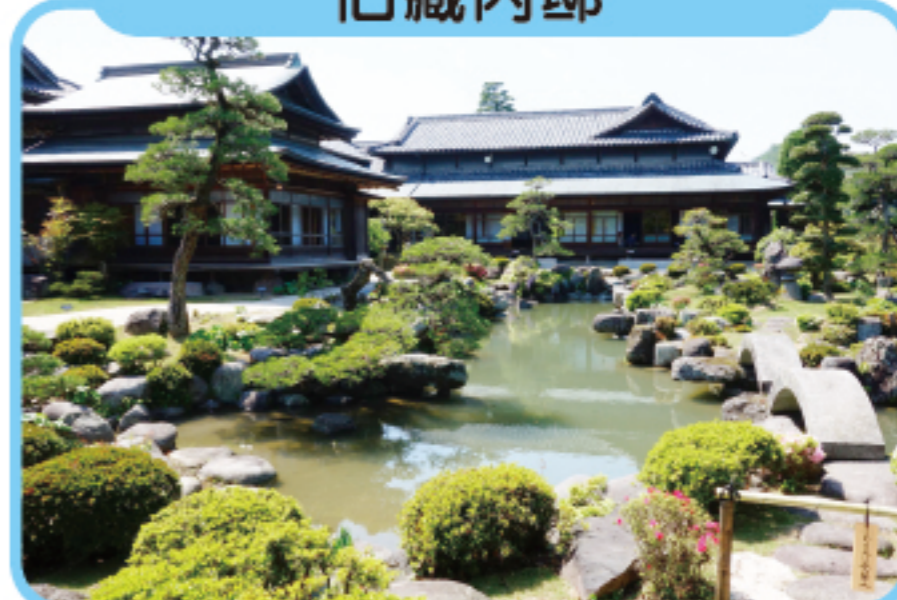
きゅうくらうちい 旧藏内邸