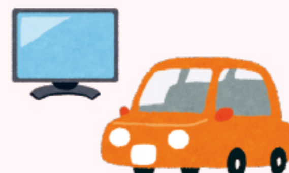
電気屋、自動車販売店など