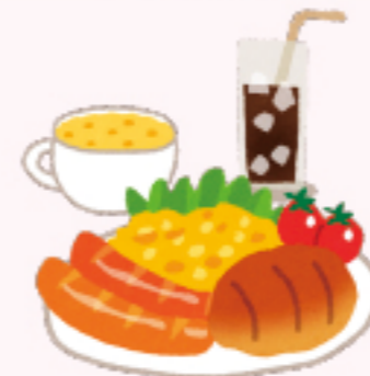
喫茶店、レストランなど