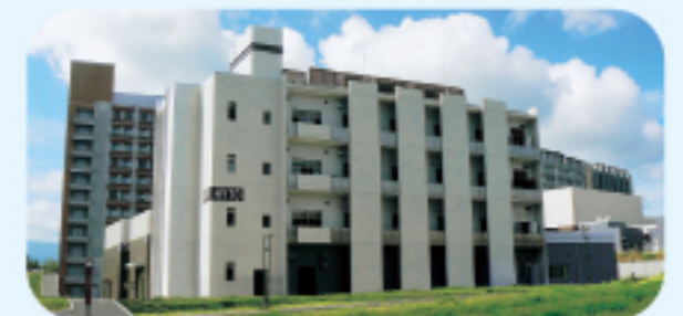
九州大学 水素材料先端科学研究センター