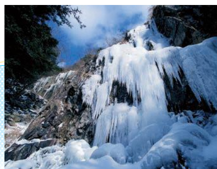
※登山には、防寒対策やアイゼンなどの準備が必要です。

〒北九州市小倉南区道原 園有(45台) ☎093-951-1024 ファクス093-951-5553 (北九州市小倉南区役所総務企画課)