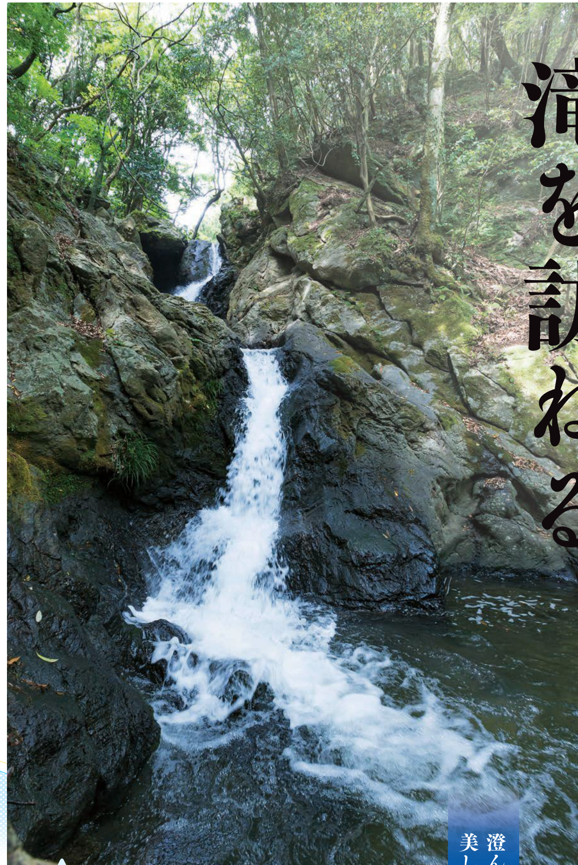
美しい 澄んだ滝つぼが

暑い季節に涼を求めるお出かけスポットとして、人気を集める「滝めぐり」。滝つぼ周辺は夏も涼やかで、気分をリフレッシュしてくれる癒やしの場として多くの人が足を運んでいます。福岡県内には、観光ガイドに載っている名所からあまり知られていない穴場まで、たくさん魅力的な滝が存在しています。今回は、そんな魅力的な滝の中からいくつかをご紹介します。