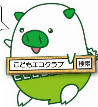
福岡県広報部長 エコトン