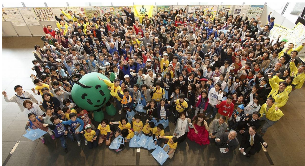
【子どもエコクラブ全国フェスティバル2015の様子】