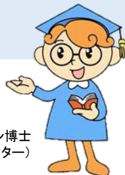
ヒューマン博士 (福岡県の人権啓発キャラクター)

本条例には、県の責務として、相談体制の充実や教育及び啓発などの県が取り組む施策を定めています。