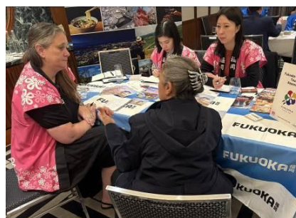
(写真) 九州観光商談会の様子

6月には、九州観光機構が主催する九州観光商談会がシドニーで開催され本県も参加した。参加者からは、東京や大阪ほど混雑していない九州での旅行には、ゆったりと過ごしてリフレッシュすることを求める声や、福岡の屋台はオーストラリアにない文化であるため関心が高いとの声が聞かれた。また、篠栗町の南蔵院や飯塚市の旧伊藤伝右衛門邸を紹介したところ、強い関心が示された。