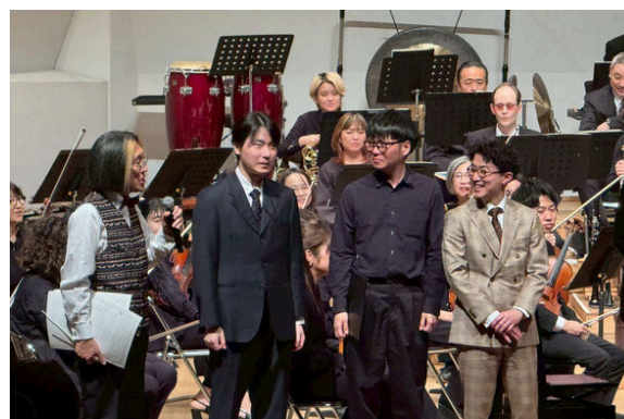
制作した楽曲は3月の演奏会で九州交響楽団により披露予定