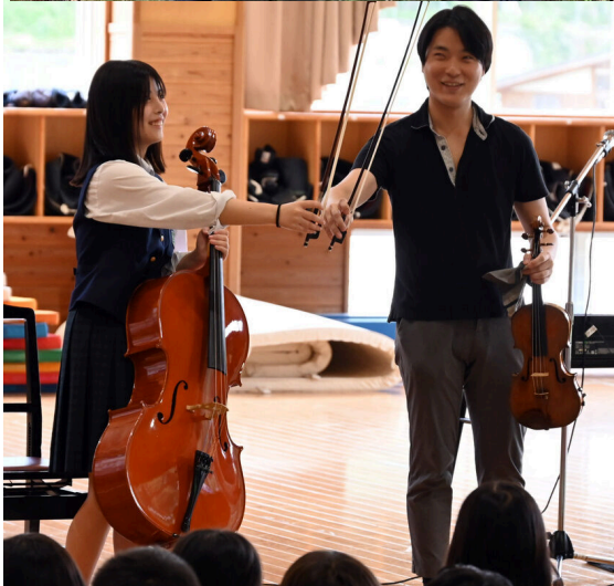
2025年度滞在中の様子