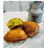
<オスピターレ・ スフォリアテッラ>