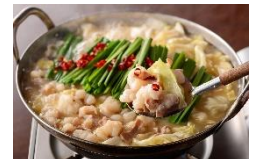
<博多芳々亭・もつ鍋>