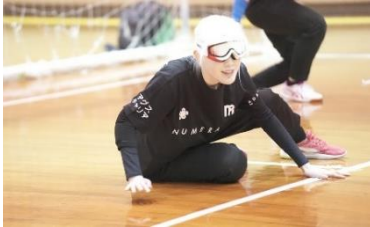
<ゴールボール競技の様子>