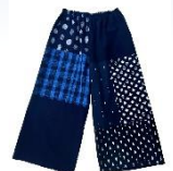
<久留米かすり藍唐・ 久留米かすりパッチワークワイドパンツ>