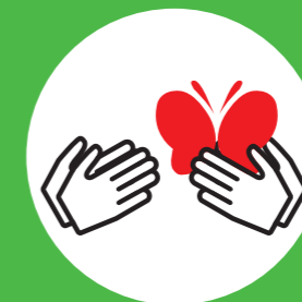
所持・譲渡等の禁止