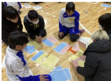
【アンチドーピング研修】