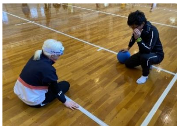
【ゴールボール競技の練習会】