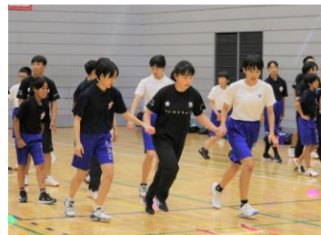
【コーディネーショントレーニング】

「世界で活躍するアスリートを目指す」という同じ志を持つタレント発掘事業の受講生と合同で、トレーニングや研修等を行っています。