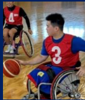
【車いすバスケットボール】