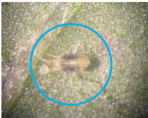
ナミハダニの雌成虫および卵