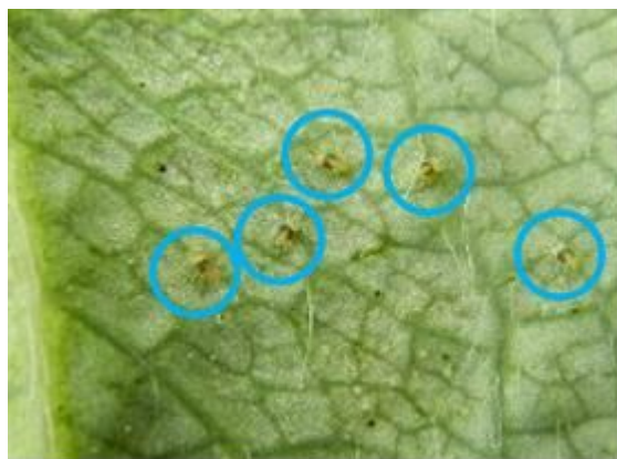
葉裏に多数寄生したナミハダニ

病害虫防除所のホームページでは、各種病害虫の発生状況を随時更新しています。発生状況の把握や防除の参考にご活用下さい。