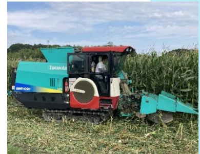
補助事業で導入した飼料収穫機