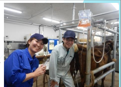
優良黒毛雌牛からの採卵