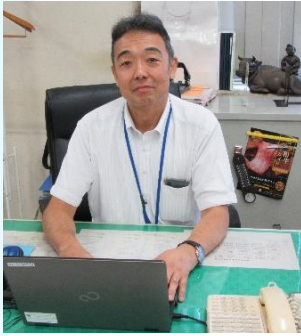
農林水産部 畜産課長