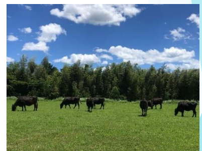
繁殖牛の放牧風景