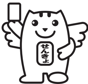
選挙の「めいすいくん」

※選挙公報の掲載順は、くじによって決められたものです。立候補の届出順とは異なる場合があります。