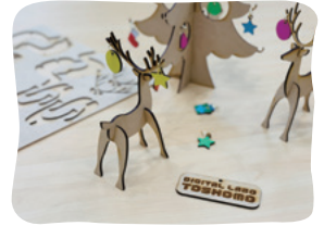
「デジタルラボとしよも」で作られた作品

そしておすすめのグルメは、JR田川後藤寺駅近くにある「若とり」の名物、たっぷりのゆずこしょうと酢じょうゆで食べる唐揚げです。一度食べるとやみつきになるのだそう！ぜひ足を運んで、ものづくりとグルメを堪能してみませんか？