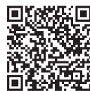
南筑後地域未来の地域リーダー育成プログラム