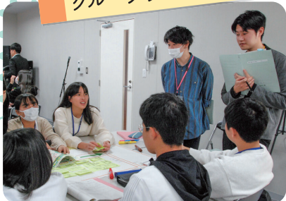
グループワークの様子※