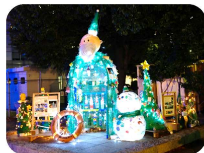
海岸漂着物アート作品(参考)