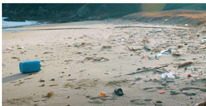
海岸に漂着したごみ