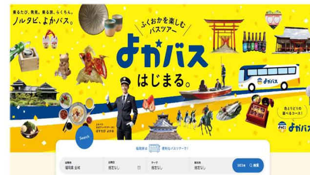
<「よかバス」ポータルサイト>