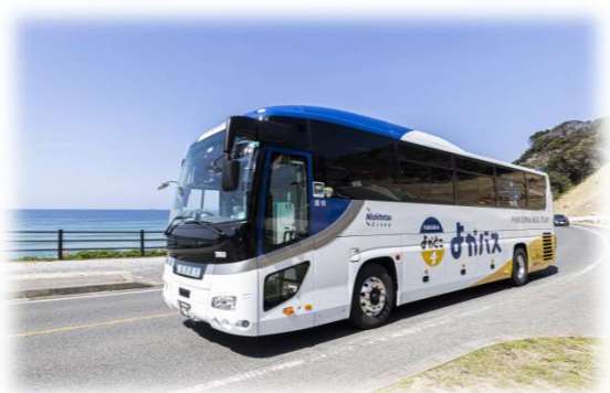
<県内周遊バスツアー「よかバス」>