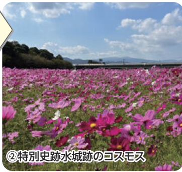
②特別史跡水城跡のコスモス