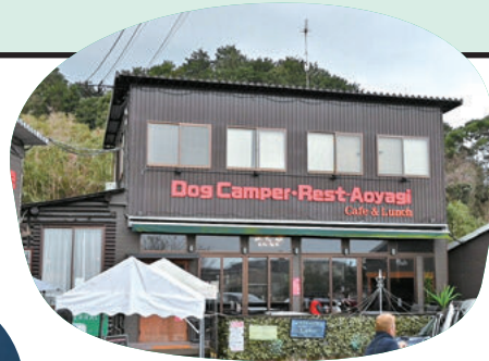
海が見えるキャンプ場も備えた「ドッグキャンパー・レスト青柳」