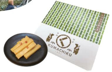
「くまちく」はご飯のおともやおつまみにも最適!